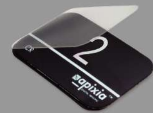
プラスチックカバー