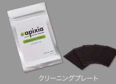
クリーニングプレート

Apixia EXM® PSP スキャナーには独自のクリーニングシステムが搭載されています。専用のクリーニングプレートをPSP スキャナーに挿入することで、簡単に内部のメンテナンスが可能です。