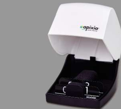
イメージングプレートボックス プレートを簡単に、安全に持ち運ぶことができます。