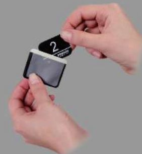
使い捨てセンサーカバー 交差感染を防ぎ、環境にも優しいカバーです。